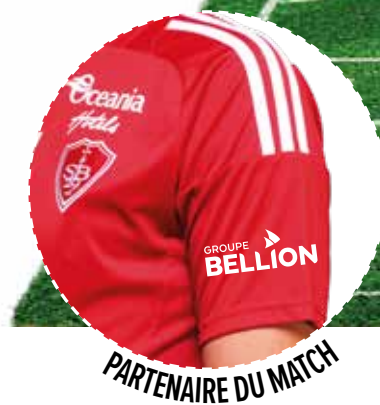
PARTENAIRE DU MATCH